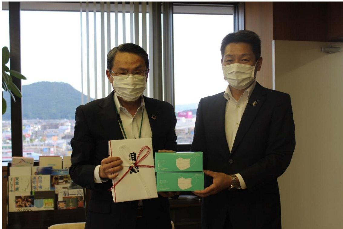
J A 共済連福島県本部からのマスク寄贈（令和 2 年 6 月 8 日 厚生連役員室にて）